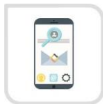
通过账号和手机验证码 重置密码