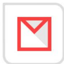
通过账号和邮箱 重置密码